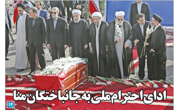
ادای احترام ملی به جانب‌آختگان منا

مجلسی می‌خواهیم که نماد ادب و متانت باشد