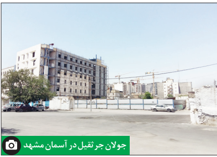
جولان جرثقیل در آسمان مشهد