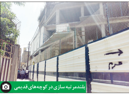
بلندمرتبه‌سازی در کوچه‌های قدیمی