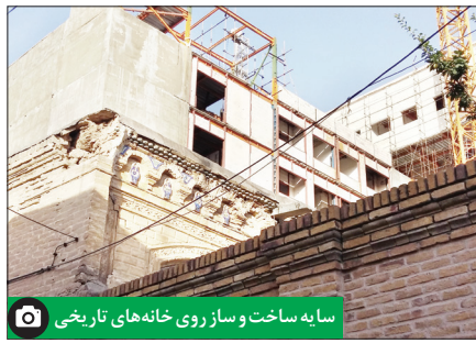
سایه‌ساخت و ساز روی خانه‌های تاریخی