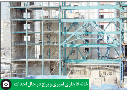
خانه قاجاری امیری و برج در حال احداث