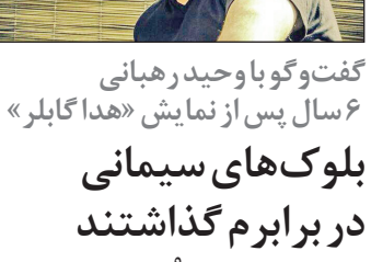
مهر متشر خواهد شد