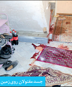
اهالی خیابان طالقانی صبح خود را با خبر قتل عام آغاز کردند