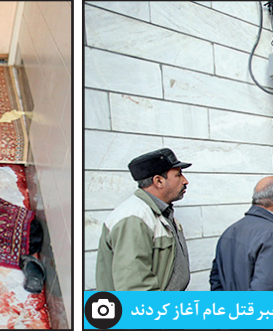
اهالی خیابان طالقانی صبح خود را با خبر قتل عام آغاز کردند