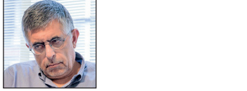
سید محمد غرضی؛