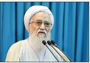
آیت‌الله موحیدی کرمانی در نماز جمعه:

عارف در دیدار با جوانان حزب اعتدال و توسعه: به ائتلاف با گروه‌های همسواصرار داریم