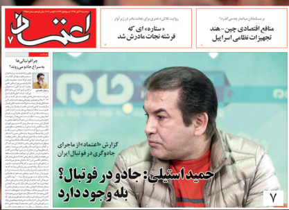
با نگاه اطلاع‌رسانی دفتر مقام معظم رهبری