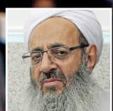
تقدم منافع ملی بر منافع قومی مولوی عبدالحمید - ۴