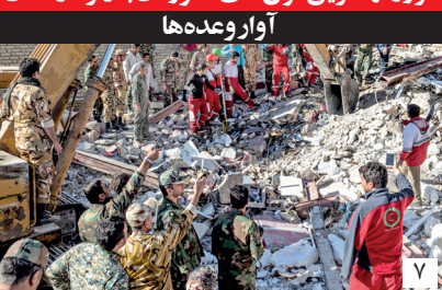
آوار و عده‌ها