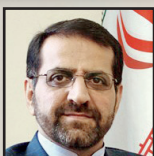
رابطه صمیمی با همه همسایگان