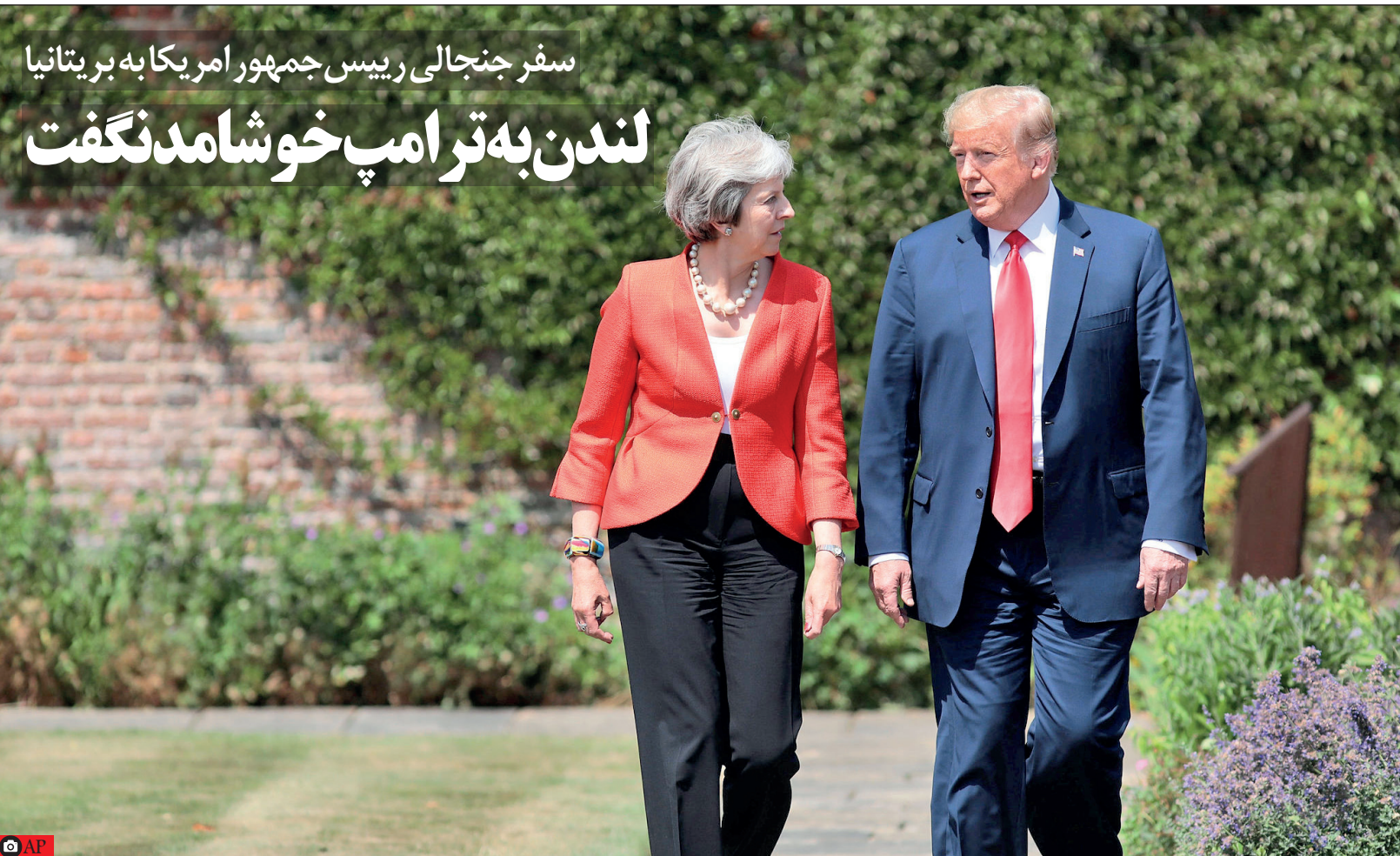
دونالد ترامپ در جریان دیدار با نخست‌وزیر بریتانیا، تراسا مای، در لندن، ۱۷ ژوئن ۲۰۱۸

لندن به ترامپ خوشامدنگفت سفر جنجالی رییس‌جمهور امریکا به بریتانیا دونالد ترامپ رییس‌جمهور امریکا در لندن، ۱۷ ژوئن ۲۰۱۸