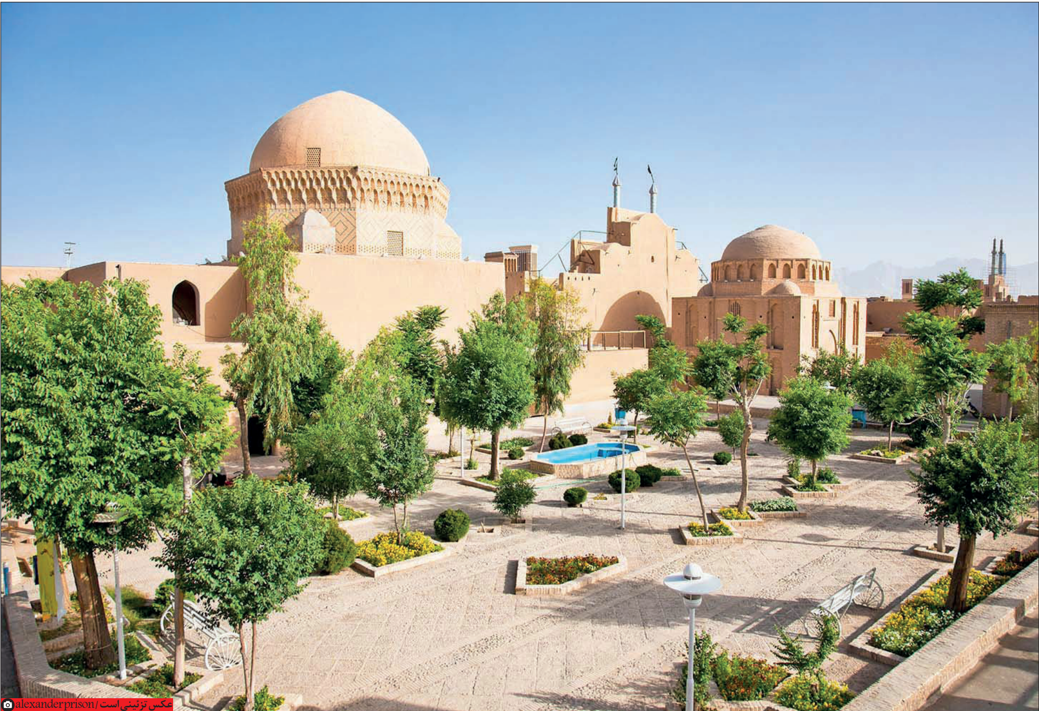
عکس تزئینی است